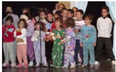
Actuación del coro infantil de la iglesia

La iglesia participó, junto con decenas de asociaciones y voluntarios de Salou, en la gala benéfica “Mundo Mágico” celebrada en el Teatre Auditori de Salou para recaudar fondos para la Asociación Aiguamarina de personas con discapacidad de la ciudad. El espectáculo combinaba música, danza, magia y diferentes bailes culturales, y contó con la participación del coro infantil de la iglesia, que además colaboró con el vestuario, la escenografía, los actores y el sonido.