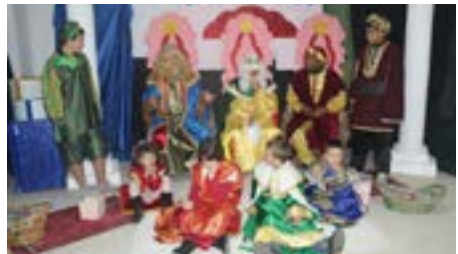
Los sabios de Oriente