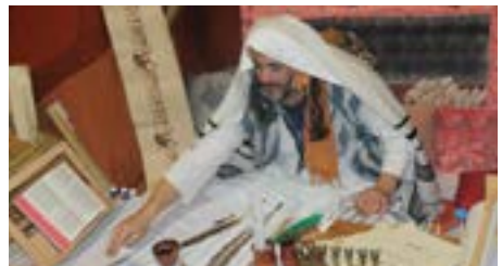
La escuela de escribas