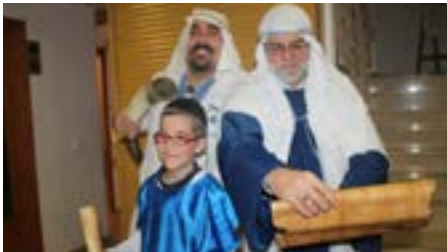
El profeta Isaías

Una vez llegados a Belén, el público hizo un recorrido por diversos lugares de aquel Belén del año en que nació Jesús, todo dentro del recinto de la Iglesia. Allí pudieron ver a los sabios de Oriente, visitar una carpintería y una escuela de escribas y tomar café en una posada, entre muchas otras cosas. Finalmente, el recorrido finalizó en el lugar donde estaba representado el nacimiento de Jesús, el Pesebre.